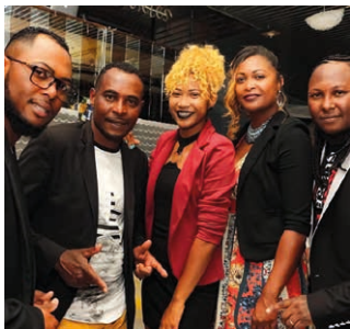
Le groupe Lumière